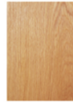
突板サンプル A4 サイズ 1 枚 ¥1,000